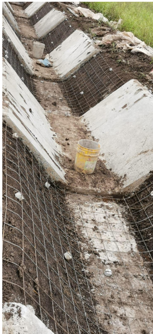
Construcción de pizarras y piso, en canal secundario existente.