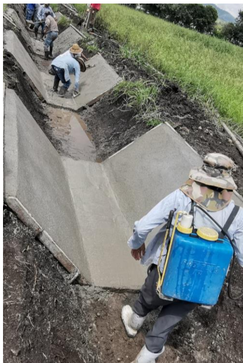
Acabados en canal secundario y aplicación de membrana de curado.