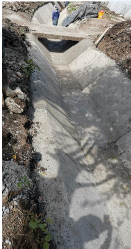
Mejoramiento de canal secundario con pizarras y piso conformando planchas con una sección aproximada de 3.00 por 2.00 metros de longitud.